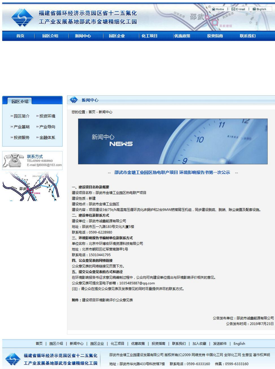
图 2-1 项目环境影响报告书第一次公示(网站截图)