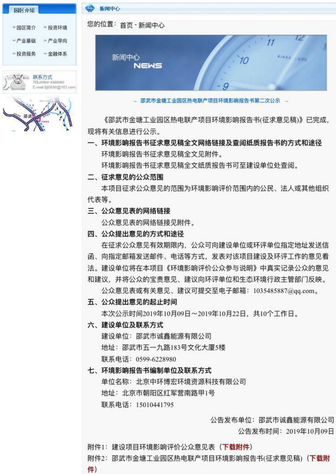
图 3-2 项目环境影响报告书第二次公示(网站截图)