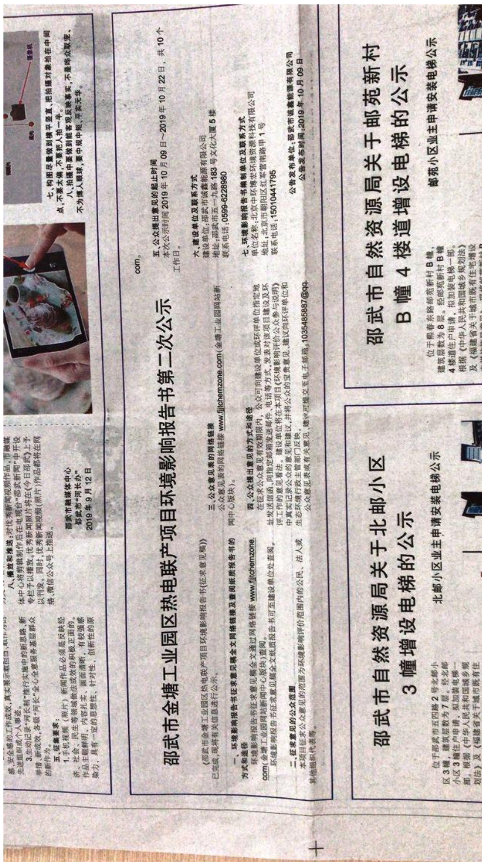
图 3-4 《今日邵武》报纸公示(2019.10.16)