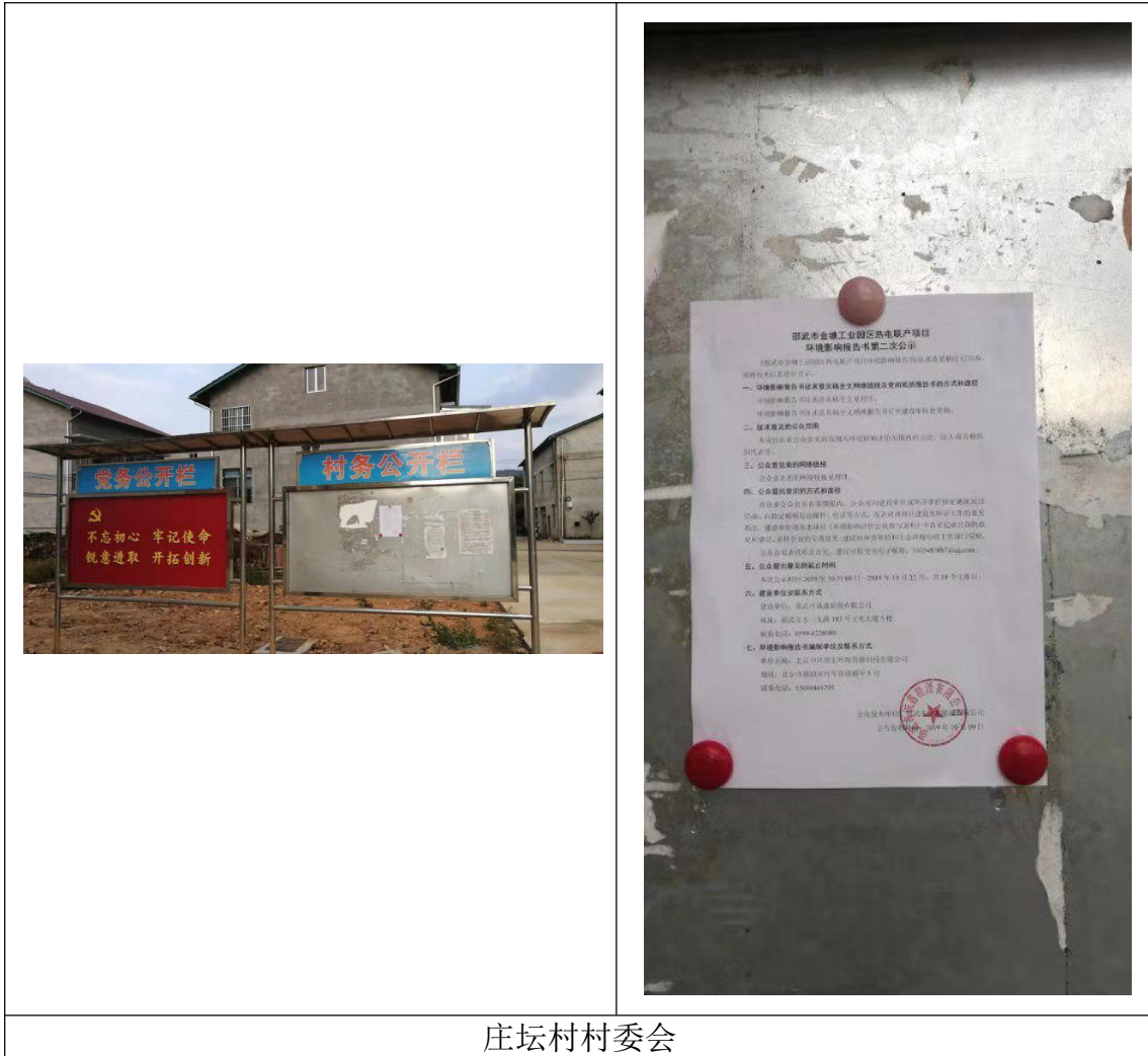
图 3-5 公示张贴照片